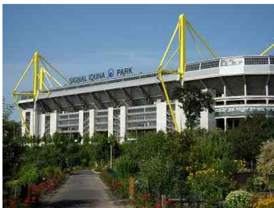
Der Signal-Iduna-Park, Spielstätte des BVB