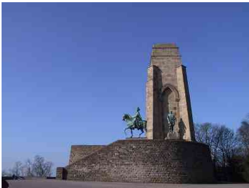
Auf der Hohensyburg