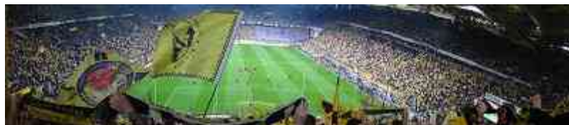
Der Signal-Iduna-Park, Spielstätte des BVB