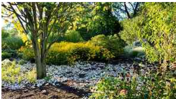
Der Westfalenpark mit dem Florian-Turm