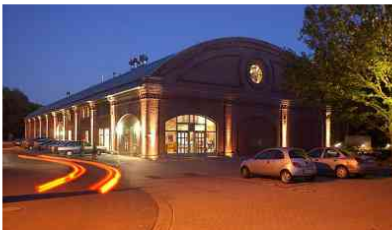
Die Rohrmeisterei in Schwerte