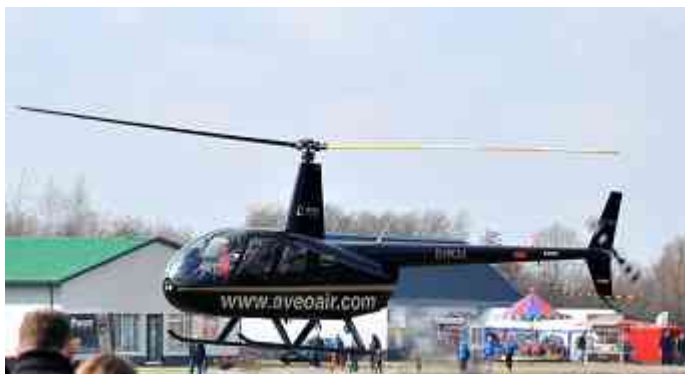
Links: Foto: © Manfred Weber, rechts: Foto: © RevierHeli / AveoAir