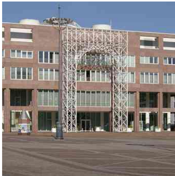
Dortmunder Rathaus / Bürgersaal