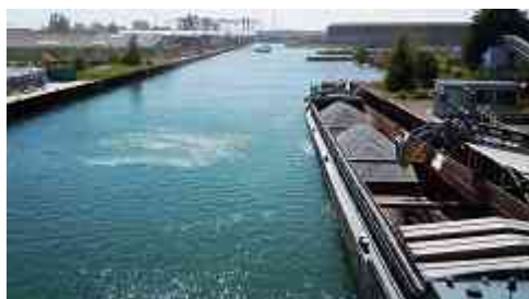
Dortmunder Hafen und ehemaliges Hafenamt

Gemeinsamer Ausflug auf den Spuren der ROUTE INDUSTRIEKULTUR